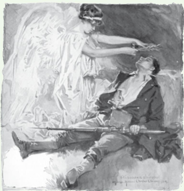
Au Champ d'Honneur (par Howard Chandler CHRISTY, 1914)

Indien u interesse hebt hiervoor, neem contact op met het secretariaat van KNVRO.