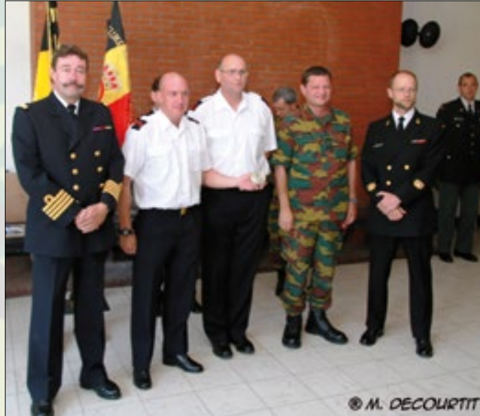
Reserve Kapitein-ter-Zee P. HUGET, overhandigt de Prijs van de Com- mandant van de Marinecomponent aan de ploeg DIVMAR-CANADA

1. Gent - 2. CRC Glons & Vlaams Brabant 3 - 4. Jagers Voorop - 5. DIVMAR-Canada