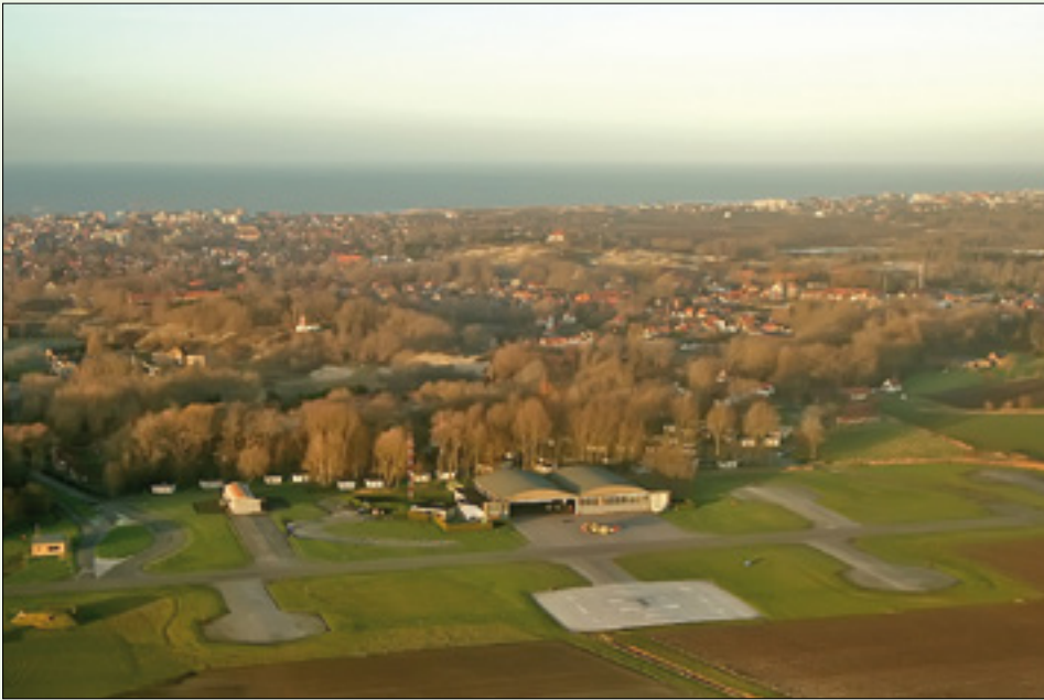
Basis Koksijde La Base de Coxyde