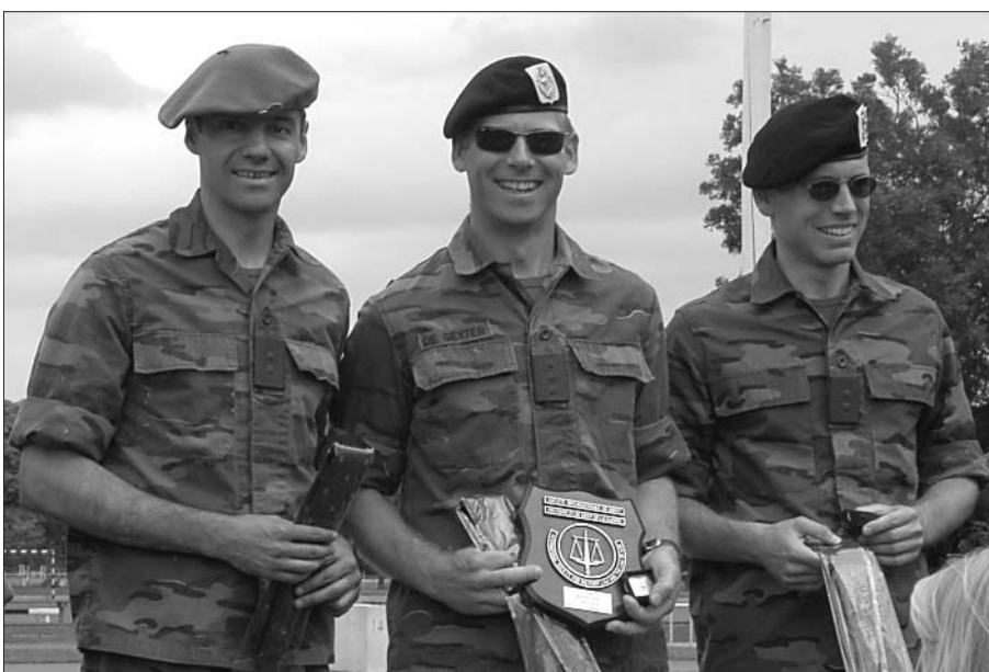
Gouden Medaille in LOAC voor ploeg BEL3

INT2: Zilveren Medaille in algemeen klassement van internationale ploegen.