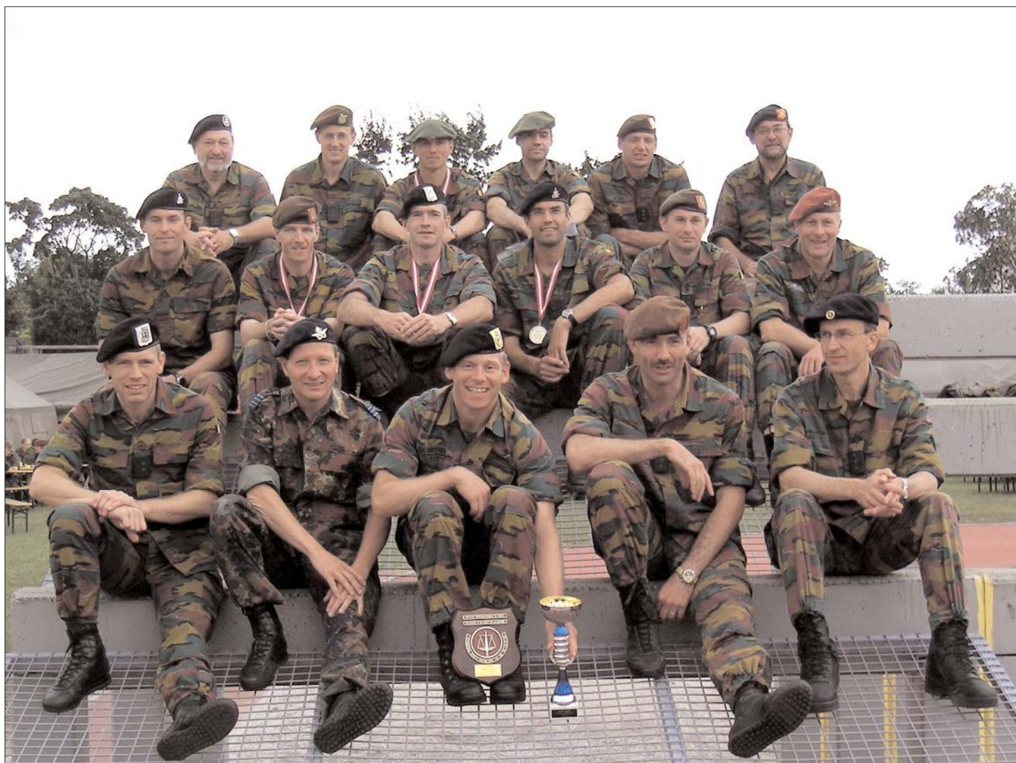
De Belgische delegatie aan de CIOR Militaire Competitie 2004

UNION ROYALE NATIONALE DES OFFICIERS DE RÉSERVE DE BELGIQUE a.s.b.l. KONINKLIJKE NATIONALE VERENIGING VAN DE RESERVEOFFICIEREN VAN BELGIË v.z.w.