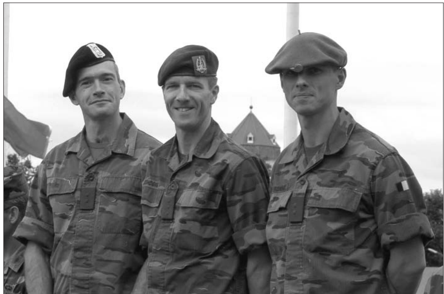
Gouden Medaille in First Aid voor ploeg BEL2

31 Jul 04: Er stond een officieel bezoek aan Wenen op het programma. De geleide rondrit beperkte zich tot een busreis van 3 uur door Wenen met een te beperkte uitleg. In de namiddag brachten we een kort bezoek aan het "Heeresmuseum" ofwel Legermuseum. Dit prachtige museum was een langer bezoek waard. Ondanks het feit dat we op wandelafstand van het centrum waren werden we terug op de bus geladen en aan de andere kant van het centrum afgezet om naar de Heldenplatz te wandelen (rare jongens die Oostenrijkers).